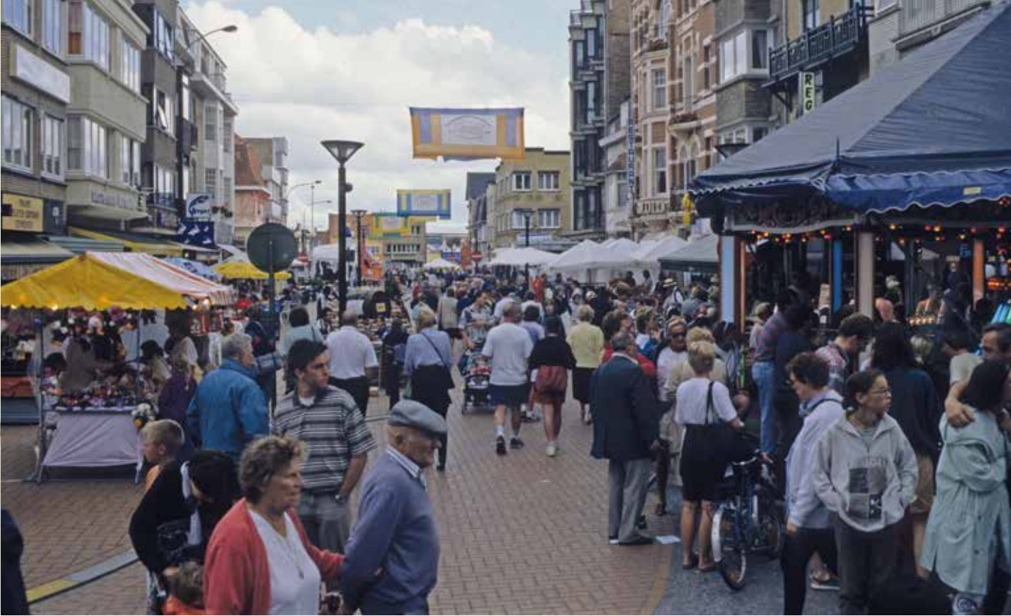
drukte tijdens het feestjaar 1996

worden. Heel wat handelszaken werden vrij getrouw aan de vooroorlogse versie opgetrokken. Dat was het geval met 'Le Home' en 'A la Corbeille'.