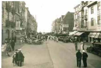
de eerste terrassen

De Meeuwenlaan groeide uit tot een straat met een gevarieerd logiesaanbod. De hotels Splendid en Régina mikten op een traditioneel toeristisch publiek, terwijl de 'Home des Invalides' zich specifiek richtte tot de oorlogsslachtoffers die massaal uit de Eerste Wereldoorlog kwamen. Ook in de 'Résidentie Beau Site', waar onderaan ook de meubelzaak van Alois De Busschere – Van Hecke gevestigd was, werden logies aangeboden. Bij de horeca verschenen